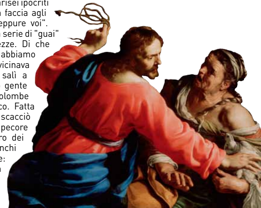
Bernardino Mei Cacciata dei mercanti dal Tempio; Getty Museum, Los Angeles

«Distruggete questo tempio e in tre giorni lo farò risorgere»