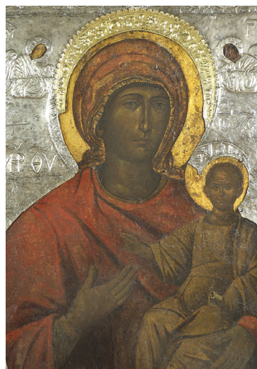
Atto di consacrazione alla B.V. Maria, Madonna della Salute in tempo di pandemia