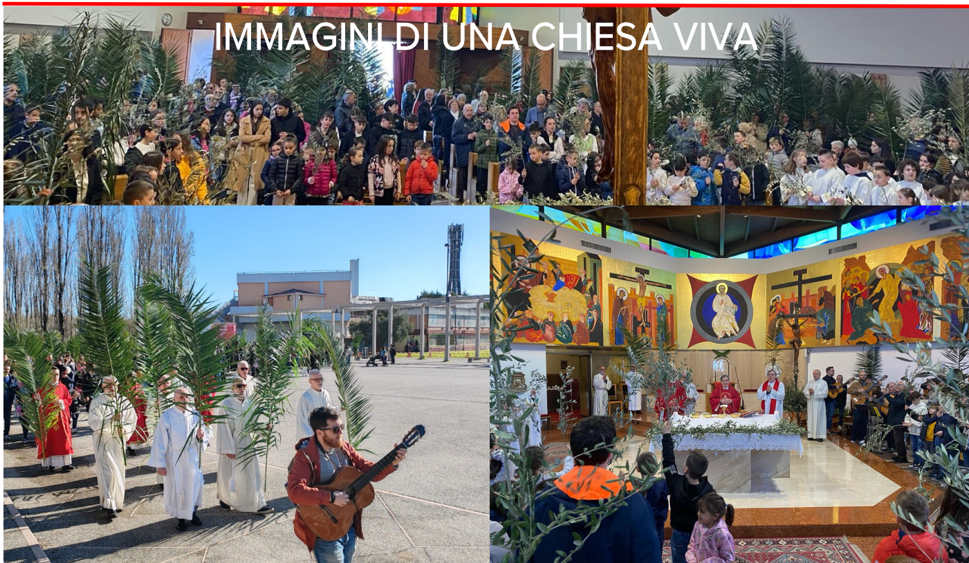
Domenica delle Palme: processione e Santa Messa